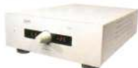
ISEM XTASIS : 1 500 EUROS